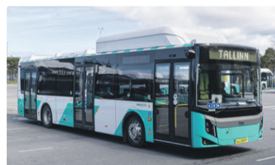
Новые газовые автобусы.

Новые аккумуляторные троллейбусы экологичны, а кроме того еще и помогают снизить риски с точки зрения обеспечения стабильной работы общественного транспорта. Например, в ситуациях, когда возникают перебои с поставками топлива или резкие колебания цен. При необходимости такие троллейбусы смогут работать круглосуточно: аккумуляторы подзаряжаются прямо во время движения, а без подключения к контактной сети троллейбусы способны преодолевать до 25 километров. Всего на улицы выйдет 40 новых современных аккумуляторных троллейбусов, при этом мы предусмотрели возможность дополнительно закупить