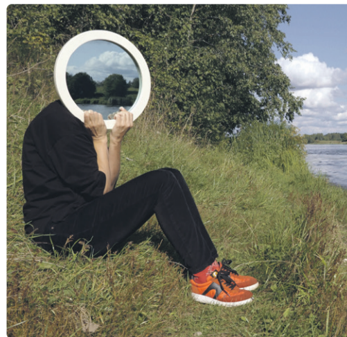
Кадр из видео "Представляя границу"

С помощью фотографий, видеоработ, инсталляций, текстиля и личных архивов Капаева исследует границу не только как географическую линию, но и как телесное, эмоциональное и затрагивающее идентичность явление. Хотя нам нравится упорядочивать мир и категоризировать увиденное, внутренний мир человека гораздо более изменчив и многообразен, чем могут определить какие-либо границы. В образовательных программах мы изучаем, из чего состоит человек. Для чего нужно из-