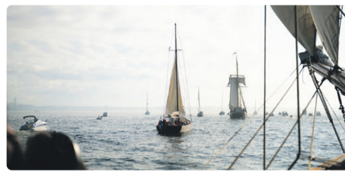
Одним из самых ярких событий фестиваля традиционно является морской парад.

Крупнейший в регионе Балтийского моря ежегодный морской фестиваль предложит публике множество морских приключений и увлекательных сценических выступлений в рамках насыщенной программы развлечений. В этом году поездки по заливу в рамках фестиваля будут предлагать три парусника из Эстонии и шесть из Финляндии. Два из них – финские суда Johanna Saturn и Diana – будут участвовать в Днях моря впервые. Начало фестиваля ознаменуется грандиозным морским парадом, за которым можно будет наблюдать как с берега, так и с палуб парусников. Важной частью Дней моря традиционно является масштабная кон-