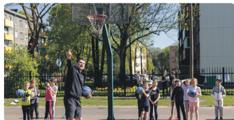
Тренировки проводятся под руководством квалифицированных тренеров.