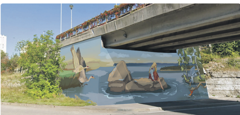
«Жемчужины времени» – эскиз Nikole BK для моста Линдакиви

В этом году росписи появятся на мостах Выйдуйооксу, Линдакиви и Саарепийга. Работы на мосту Палласти планируется выполнить в следующем году, по возможности синхронизируя их с реконструкцией моста, чтобы сэкономить деньги налогоплательщиков.