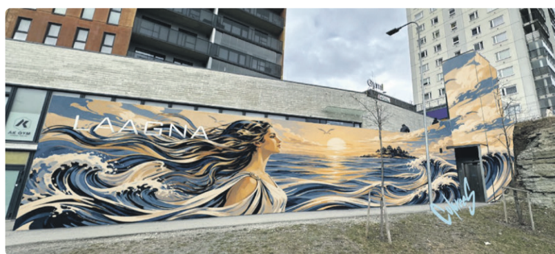
Для моста Саарепийга жители выбрали эскиз Colorees Art «Закат и Девушка-островитянка»