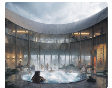
Эскиз: Atelier Lorentzen Langkilde ApS

Компания SPA Tours, развивающая спа-комплексы в Виймси, Ыйсмяэ, на Сааремаа и в Ида-Вирумаа, совместно с Таллиннской городской управой и Союзом архитекторов Эстонии определила победителя архитектурного конкурса на проектирование спа-комплекса с саунами по адресу ул. Махтра, 2а.