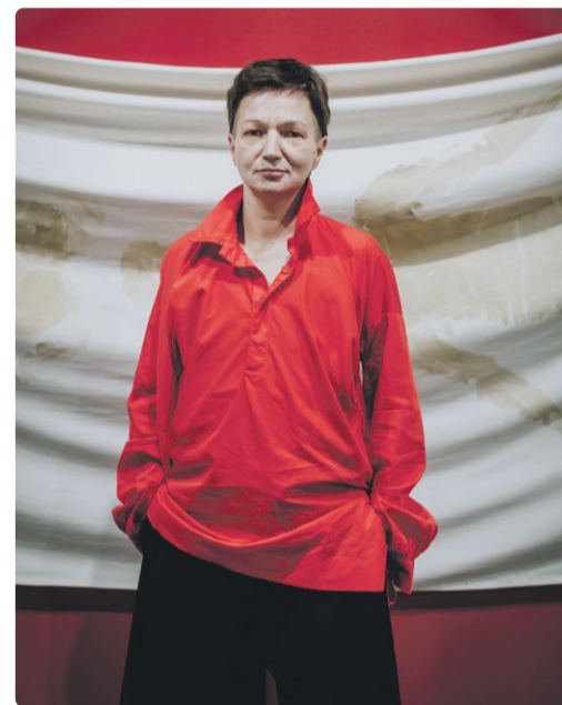
Kunstnikutuuriid Maria Kapajevaga toimuvad paviljonis 17. juunil ja 16. augustil.

Kuidas aga koondada kõik need killud tervikuks? Ja kas seda ongi vaja? Kui juba minu enda sees põimuvad niivõrd paljud erinevad piirid, siis võib-olla ei peagi enda identiteedi ümber jäika piiri tõmbama ning pi-