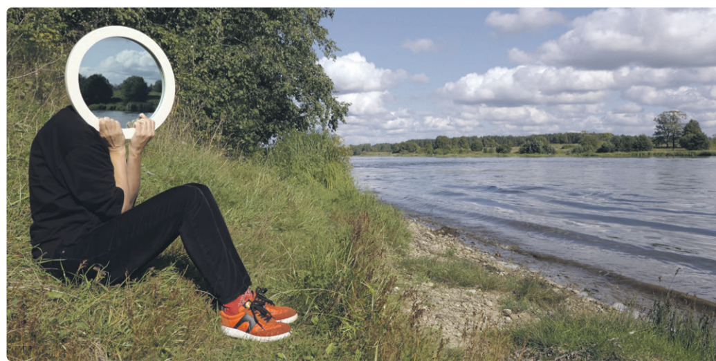
Kuvatõmmis näitusel esitletavast videost „Esitades piiri“

Haridusprogrammidele registreerumine: publik@kunstihoone.ee .