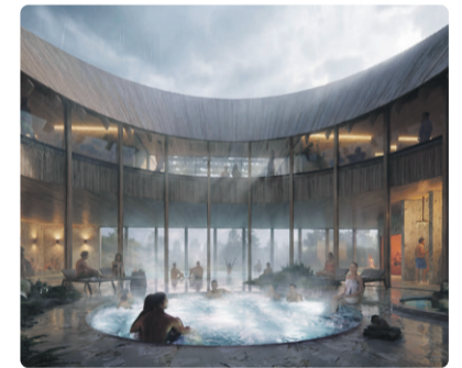
Võiduude kavand: Atelier Lorentzen Langkilde ApS

Mitmeid spaakeskusi Viimsis, Öismäel, Saaremaal ja Ida-Virumaal arendav pereettevõtte SPA Tours valis koostöös Tallinna Linnavalitsuse ja Eesti Arhitektide Liiduga välja Mahtra 2a kinnistule rajatava spa- ja saunakeskuse arhitektuurivõistluse võidutöö. Võitjaks osutus Taani arhitektuurbüroo Atelier Lorentzen Langkilde ApS ideekavand „Saladus“.