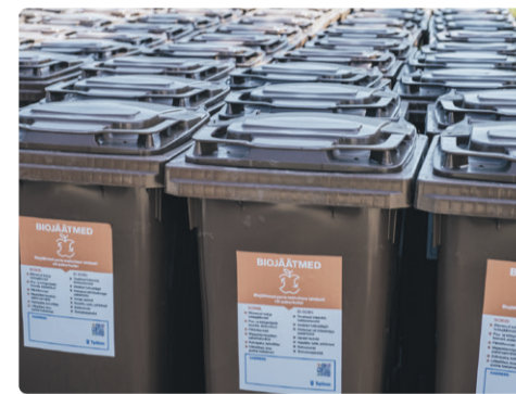
Kui jäätmed kogutakse liigiti, on võimalik vähendada nii tühendamissagedust kui ka kulusid.

Lisainfot jäätmereformi ja jäätmete liigiti kogumise võimaluste kohta leiab Tallinna veebilehelt: www.tallinn.ee/jaatmereform . Korteriühistud ja eramajajad, kes vajavad jäätmete kogumise korraldamisel nõu või abi, saavad pöörduda Tallinna strateegiakeskuse ringmajanduse osakonna poole aadressil jaatmed@tallinnlv.ee .