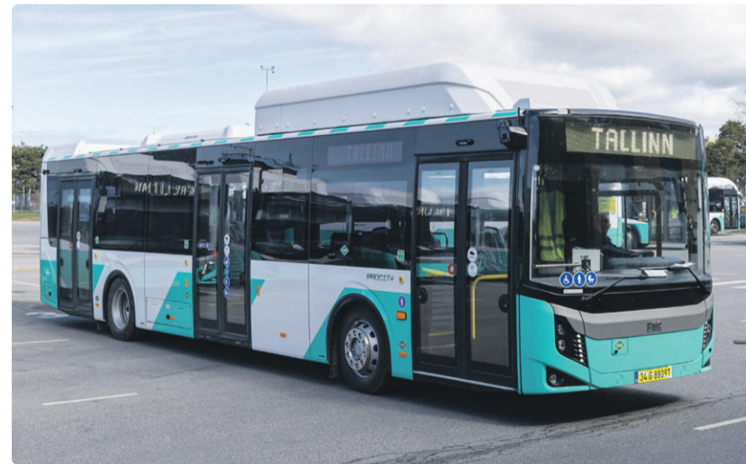
Uued Tallinna gaasibussid.

Seetõttu peame analüüsima ka alternatiivi viia kiire rööbastransport Tallinna kesklinna maa-