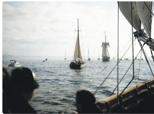
Festivali üks vaatamängulisemaid sündmusi on traditsiooniline mereparaad.

Traditsiooniliselt on merepäevade oluliseks osaks tugev kontserdiprogramm. Tänavu tähistab ansambel Singer Vinger oma