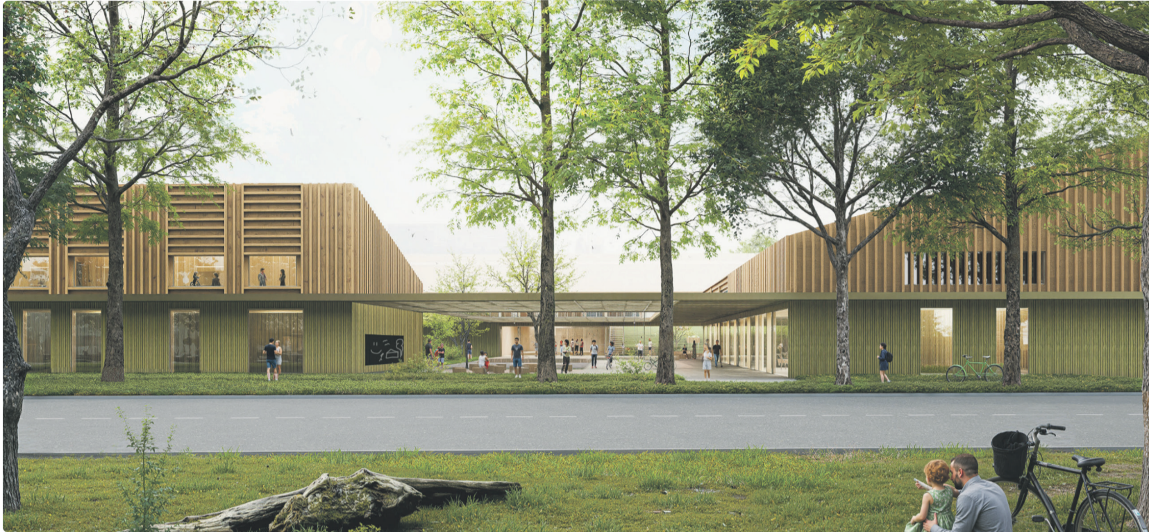
2029. aastaks ehitatakse kooli krundile uus õppehoone. Kavand: Arhitekt Must OÜ

Linnaosavanema vastuvõtt esmaspäeviti kell 15–18, vajalik eelregistreerimine tel 645 7715