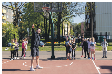
Pilt: Trenne viivad läbi kvalifitseeritud treenerid.