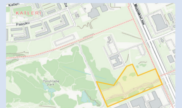
Территория планировки охватывает земельные участки по адресу Мустакиви тез, 21а, Мустакиви тез, 23 и Мустакиви тез, 23б.

16 апреля 2026 г. Таллинское городское собрание решением № 55 инициировало детальную планировку земельных участков Мустакиви тез, 21а, Мустакиви тез, 23 и Мустакиви тез, 23б, а также приняло решение отказаться от инициирования стратегической оценки воздействия на окружающую среду в районе Ласнамяэ. Зону планирования охватывает земельный участок площадью 12,05 га, точные границы которого приведены на схеме, прилагаемой к решению. Цель составления детальной планировки – перераспределение земельных участков Мустакиви тез, 21а, Мустакиви тез, 23 и Мустакиви тез, 23б, а также установление права на застройку комплекса новой государственной гимназии. Кроме того, определяются возможные местоположения подъездных дорог, строительные и архитектурно-планировочные условия, а также устанавливаются принципиальные решения вопросов организации движения, парковки, озеленения, благоустройства и необходимых инженерных сетей. В составе детальной планировки предусмотрено предложение о внесении изменений в общую планировку жилых территорий Ласнамяэ путём частичного изменения функционального назначения коммерческо-зелёной зоны на зону общественного пользования и размещения социальных объектов. Принято решение об отказе от инициирования стратегической оценки воздействия на окружающую среду ввиду отсутствия предполагаемого значительно-