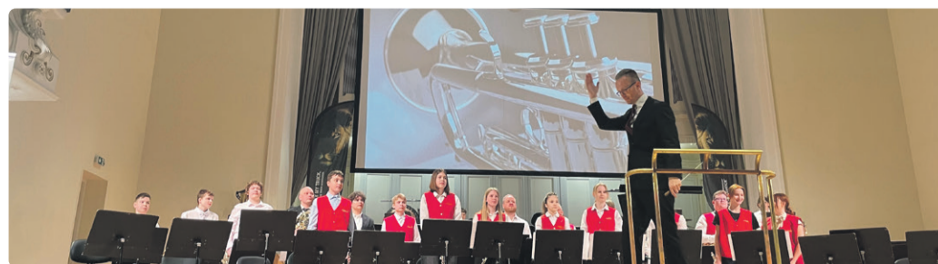
Духовой оркестр школы выступает на «Турнире духовых оркестров Эстонии 2026» в концертном зале «Эстония»