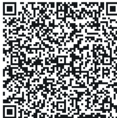
С помощью QR-кода можно легко попасть на сайт регистрации

X народный забег Ласнамяэ приглашает всех присоединиться к юбилейному празднику вне зависимости от того, будет ли это первым стартом, поставленной перед собой новой спортивной целью или просто возможностью провести день в активной и вдохновляющей атмосфере.