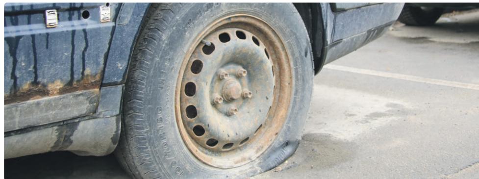
Эвакуация применяется как крайняя мера в случаях, когда автомобиль явно остался без внимания владельца

Помимо эвакуации, на десятки простаивающих автомобилей были установлены предупреждающие таблички «ТС подлежит эвакуации». Таким образом мы дали владельцу или ответственному пользователю разумный срок для добровольного вывоза автомобиля из общественного пространства. По истечении этого срока ТС, в зависимости от