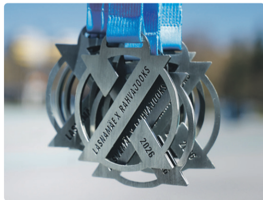
Дизайн медали отсылает к первому серьезному юбилею народного забега

В этом году забег отмечает свой первый серьезный юбилей, объединяя как постоянных участников спортивных мероприятий, так и тех, кто только открывает для себя радость движения. Юбилейный старт предложит насыщенный программу, дистанции для разных возрастов и отличное настроение для всей семьи.