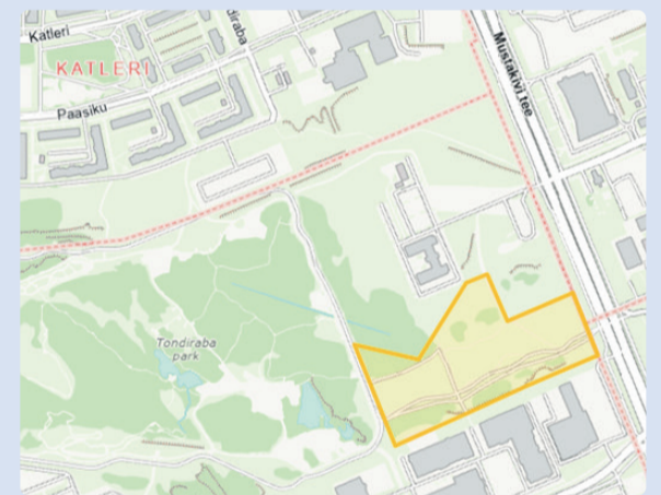
Mustakivi tee 21a, Mustakivi tee 23 ja Mustakivi tee 23b kinnistute detailplaneeringu ala. Välvavõtte Maa- ja Ruumiameti geoportaalist

Keskkonnamõju strateegiline hindamine jäeti algatamata, kuna kavandatav tegevus ei oma eeldatavalt olulist keskkonnamõju ning võimalikud mõjud on leevendatavad tavapäraste planeerimis- ja projekteerimismeetmetega.