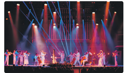
Kristjan Järvi ja ansambel Nordic Pulse.

Kontsert „Nordic Amazonia“ sobitub Järvi sõnul suurepäraselt ka Tallinna identitee- dige, mis on segu uuest ja vanast. „Meil on korruga mets, vanalinn ja uuslinn. Meil on vesi, meil on maa – meil on siin terve väike universum ja paradisi,“ sõnas Järvi.