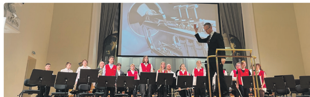
Kooli puhkpilliorkester esinemas „Eesti Puhkpilliorkestrite turniiril 2026“ Estonia kontserdisaalis

Igal suvel ootame Lasnamäe Muusika- kooli uusi õpilasi. Kooliga saab tutvuda lah- tiste uste päeval, mis toimub 1. juunil kell 17.00. Suures saalis esinevad kooli orkestrid ja ansamblid ning külalised saavad nautida muusikat ja tutvuda pillidega.