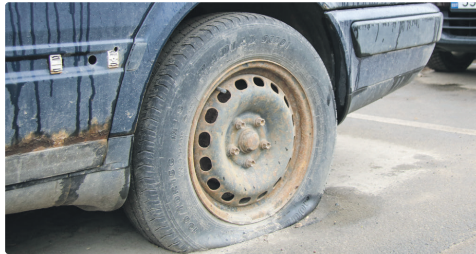
Teisaldamine on viimane samm olukorras, kus sõiduk on jäetud hooletusse

Lisaks teisaldamisele paigaldasime kümnetele sõidukitele ka hoiatussildid „sõiduk kuulub teisaldamisele“, mis annab sõiduki omanikule või vastutavale kasutajale mõistliku tähtaja sõiduki avalikust ruumist vabatahtlikuks eemaldamiseks. Tähtaja möödumisel korraldame sõiduki