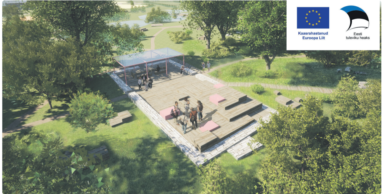
Ehitustööde käigus valmib ka mitu pargirajatist

Ehitustööde tellija on Tallinna Keskkonna- ja Kommunaalamet, ehitaja Mefab OÜ ja järelevalvet teostab TPJ Inseneribüroo OÜ. Roheala eelprojekti koostas NÜÜD arhitektid OÜ ja põhiprojekti Infragate Eesti AS. Ehitusperioodil on Vormsi roheala piiratud ehitusaia-