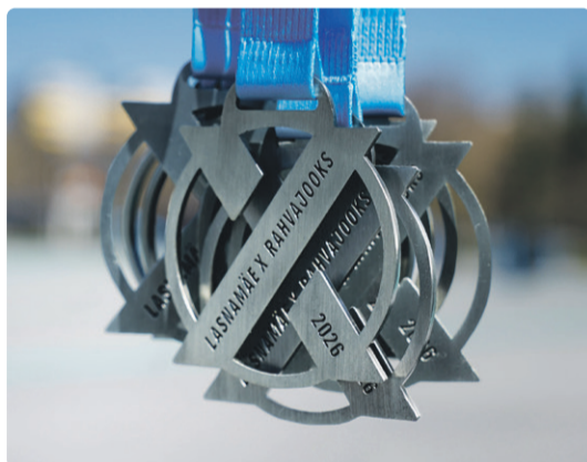
Medali kujundus tähistab Lasnamäe rahvajooksu esimest suurt juubelit

Lasnamäe rahvajooks tähistab tänava oma esimest suurt juubelit, tuues kokku nii kogunud jooksjad kui ka liikumisrõõmu avastajad. 24. mail Tondiraba pargis toimuv juubelijooks pakub mitmekesist programmi, eri vanuses osalejatele sobivaid distantse ning sportlikku meeleolu kogu perele.