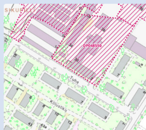
Detailplaneeringu ala. Väljavõte Maa- ja Ruumiameti geoportaalist.

Digitaalselt on materjalid kättesaadavad Tallinna planeeringute registris aadressil: https://tpr.tallinn.ee ning linnaosavalitsuse kodulehel www.tallinn.ee/et/lasnamae/ehitus-ja-planeering .