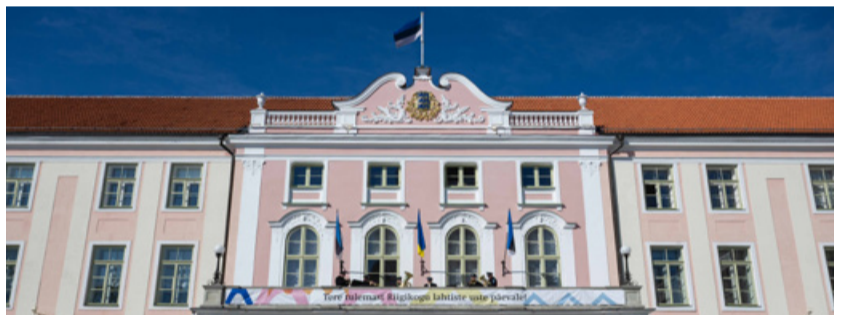
Kogu lahtiste uste päeva programm on tasuta.

1919. aasta 23. aprillil tuli Eestis kokku esimene rahva valitud esindus ehk Asutav Kogu, mis võttis vastu paljud meie riigile aluse pannud otsused. Seda päeva tähistatakse Riigikogu sünnipäevana.