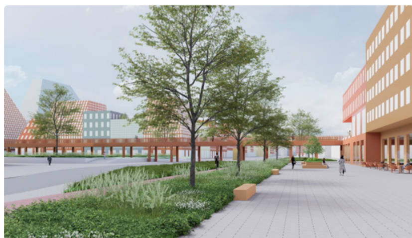
Üks ideekorjel esitatud visioonidest – Peeter Pere Arhitektide nägemus Tondiraba keskusalast

Avalikus arutelus osalemiseks on vajalik eelregistreerimine. Registreerimisevorm on avatud veebilehel: www.tallinn.ee/et/lasnamae .