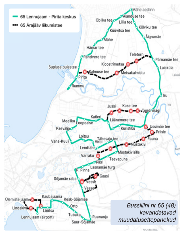
Bussiliini nr 65 (48) kavandatavad muudatusettepanekud

See looks Lasnamäe jaoks paremad ühendused Ülemiste piirkonna ja lennujaamaga ning parandaks liikumisvõimalusi ka Piritale suunal. Kõik küsimused ja tähelepanekud vaadatakse üle ning antakse koondvastus hiljemalt 30. aprilliks. Liinimuudatused on kavandatud jõustuma 1. augustil 2026.