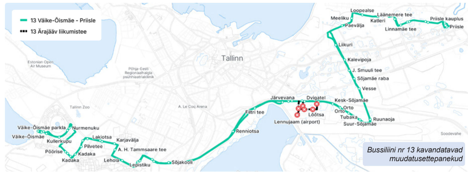
Bussiliini nr 13 kavandatavad muudatusettepanekud