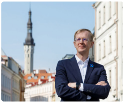
Tiit Terik Tallinna abilinnapea