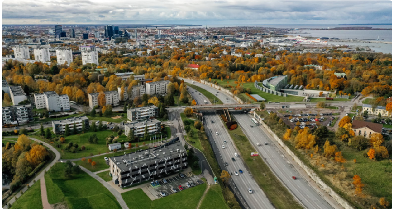
Üldplaneering peab andma selged põhimõtted, kuid jätma ruumi paindlikkusele.

Uus Tallinna üldplaneering loob ühtse, ajakohase ja tulevikku vaatava raamistiku. Fookuses on ülelinnalised võrgustikud – haridus, ühistransport, rohealad ja sinivõrgustik. Sinivõrgustik tähendab veekogude ja veega seotud alade süsteemi, mis aitab hoida ökosüsteemi, leevendada üleujutusriske ja parandada linna keskkonnaväliteeti. Eesmärk ei ole senist tööd kõrvale lükata: näiteks värske Põhja-Tallinna üldplaneering pakub häid lahendusi, mida võtame olulise sisendina kaasa.