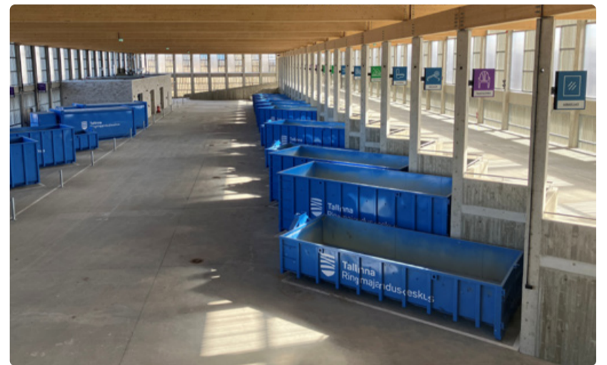
Jäätmete vastuvõtt toimub suures suletud jäätmehallis.