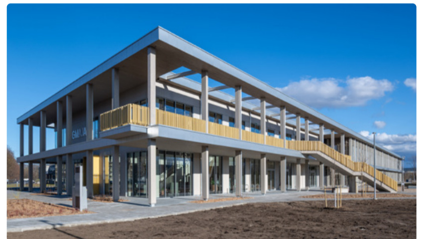
Ringmajanduskeskusesse saab mugavalt kohale bussidega nr 31, 35, 44, 48, 50, 54, 55, 58 ja 66.