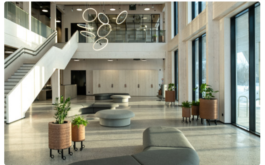
Uue ringmajanduskeskuse aatrium.

16. aprillil avatakse Lasnamäel kõigile külastajatele aadressil Toorme 2 piirkonna kaasaegsaim ringmajanduskeskus.