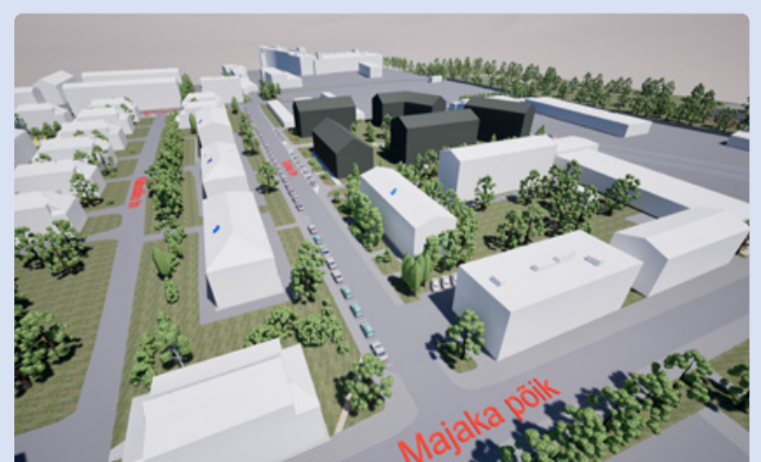
Planeeringu eskiislahendusega kavandatavad hoonete mahud. Eskiislahendus: ConArte OÜ