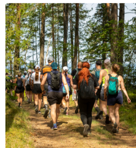
Euroopa spordipealinn Tallinna programm keskendub aprillis matkamisele.

Päeva kõige pikem, 19 km pikkune rada kulgeb marsruudil Viimsi – Lennusadam ning stardib kell 10 aadressilt Ranna tee 13b. Matka vältel saame teada, kus tangiti allveelaevu, kui pikalt põ-