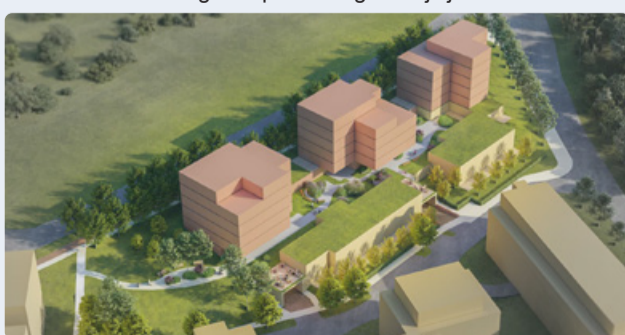
Narva mnt 174a kinnistu detailplaneering. Visualiseeringu looja osaühing R-KONSULT.

Lasnamäe Linnaosa Valitsus teatab, et Narva mnt 174a kinnistu detailplaneeringu avalik väljapanek toimub 25. aprillist 2025 kuni 12. maini 2025 Tallinna planeeringute registris ja Lasnamäe Linnaosa Valitsuses Pallasti tn 54 I korruse infosaalis, kus planeeringuga on võimalik tutvuda igal tööpäeval kogu tööpäeva jooksul. >>> LK 4