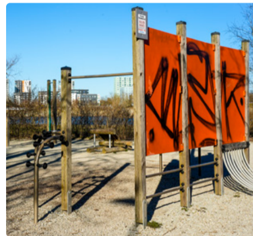
Sügiseks paigaldatakse treeningväljakutele kaasaegsed jõujaama seadmed.