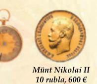
Münt Nikolai II 10 rubla, 600 €