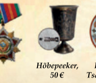
Hõbepeeker, 50 €