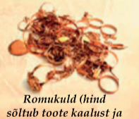
Romukuld (hind sõltub toote kaalust ja proovist)