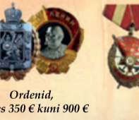
Ordenid, alates 350 € kuni 900 €