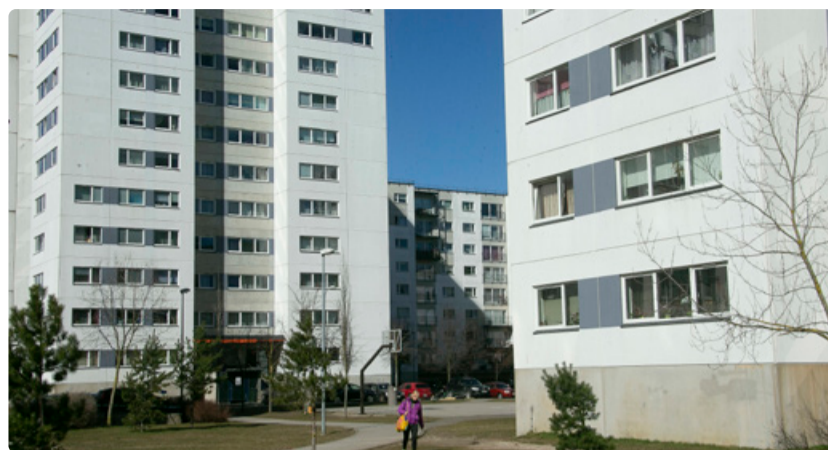
Raadiku munitsipaalkorterite elamurajoon.

Samuti on jätkuvalt tagatud linna eluruumi kasutamine sundüriks, eeldusel, et üürilepingu tingimused on täidetud. Nii sotsiaal- kui