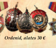
Ordenid, alates 30 €