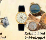
Kellad, hind kokkuleppel