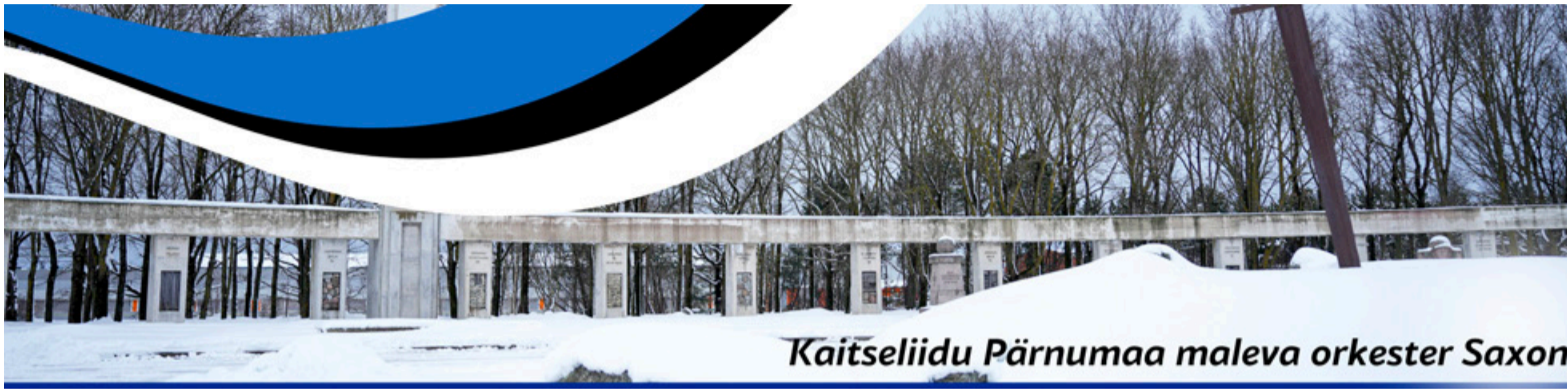
Kaitseliidu Pärnumaa maleva orkester Saxon