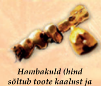
Hambakuld (hind sõltub toote kaalust ja proovist)