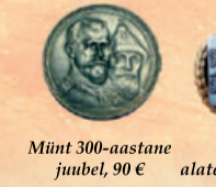
Münt 300-aastane juubel, 90 €