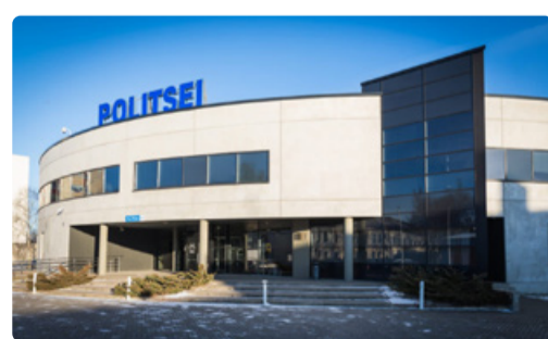
Pinna teeninduse viimane lahtiolekupäev on 29. aprill.

Pinna teeninduse sulgemisega muutub ka relvatoimingute asukoht. Edaspidi saab