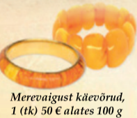
Merevaigust käevõrud, 1 (tk) 50 € alates 100 g