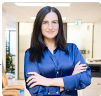
Linnaosa vanema veerg