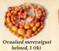
Ovaalsed merevaigust helmed, 1 (tk) 1700 €, alates 100 g