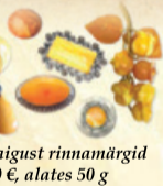
Merevaigust rinnamärgid 60 €, alates 50 g