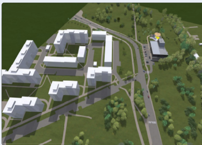
Vaade Narva mnt 133 planeeringualale ülevalt Kihnu tn ja Narva mnt nurgalt. Illustratsiooni koostaja Arhitektuuribüroo JVR OÜ.

Elamumaa sihtotstarbega Narva mnt 133 kinnistul asuvad ehitisregistri andmetel järgmised hooned: 2-korruselise