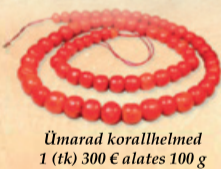
Ümarad korallhelmed 1 (tk) 300 € alates 100 g

OOTAME TEID: TALLINNAS 14. JA 15. MÄRTSIL KELL 11.00 KUNI 16.00 LINDAKIVI KULTUURIKESKUS JAAN KOORTI 22, TALLINN