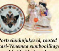
Portselankujukesed, tooted Tsaari-Venemaa sümboolikaga, hind kokkuleppel

- ROMUKULDA JA EHTEID, HAMBAKULDA (PUHASTAME). - ROMUHÕBEDAST EHTEID, HÕBENÕUSID, SÖÖGIRIISTU, TEHNILISI KONTAKTE. - EHTEID VÄÄRIS- JA POOLVÄÄRISKIVIDEGA, KELLASID. - MEREVAIGUTÜKKE (EHTEID: ÜMMARGUSI, OVAALSEID, RISTKÜLIKUKUJULISI, PISARAKUJULISI HELMEID), KÄEVÕRUSID, PROSSE, MEREVAIGUST KUJUKESI (MATIST, LÄBIPAISTMATUST MEREVAIGUST). - ORDENEID, MEDALEID, AUTASUSID, MÄRKE. - PORTSELANIST KUJUKESI, AUTORIMAALE, FOTOSID POSTKAARTE KUNI 1940.A, JÕLUEHTEID KUNI 1950.A. - KORALLEHTEID: HELMEID (ÜMARAID, OVAALSEID JA PLOOMIKUJULISI) KÄEVÕRUSID, PROSSE. *MEREVAIGU HIND SÕLTUB MEREVAIGU KVALITEEDIST, KAAJUST JA VÄRVIST.