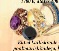
Ehted kalliskivide ja pootvääris kividega, hind kokkuleppel