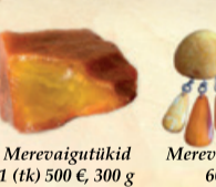
Merevaigutükid 1 (tk) 500 €, 300 g