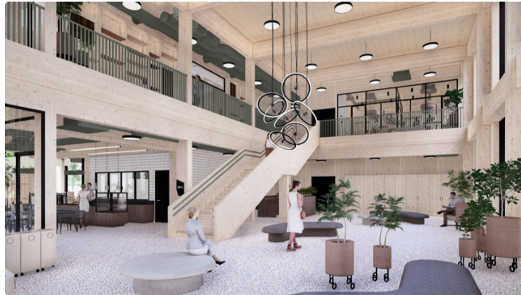
Эскиз фойе центра экономики замкнутого цикла. Автор: OÜ Kolm Koma Arhitektid.

Часть здания будет построена из дерева и покрыта зеленой крышей. Конструкция несущей системы центра позволит в будущем оперативно осуществлять перепланировки и, при необходимости, демонтаж, что упростит повторное использование материалов. Для внутреннего обустройства здания будет применяться вторичное сырье. Например, полки будут изготовлены из переработанной древесины, в дизайне осветительных приборов будут использованы материалы вторичной переработки. На крыше центра установят небольшую солнечную электростанцию, а управление зданием и его системами будет осуществляться с помощью умных технологий. В туалетах для смыва будет использоваться дождевая вода, которая также будет применяться для полива.