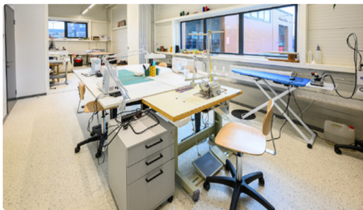
Центр экономики замкнутого цикла Лиллекюла.