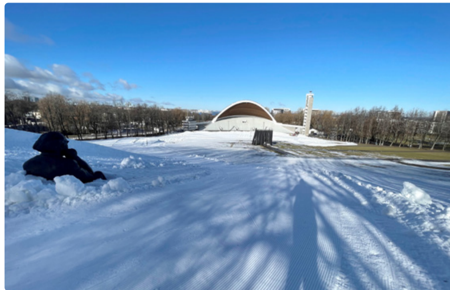
После первых ночных заморозков на Певческом поле появится лыжная трасса длиной 0,7 км.

«Мы хотим, чтобы у всех жителей Таллинна и гостей нашего города было как можно больше возможностей заниматься спортом в спортивной столице Европы. При составлении программы мы сосредоточились на развитии различных видов спорта и возможностей для занятий ими, чтобы каждый мог найти то, что мотивирует его больше всего», – сказал вице-мэр Таллинна Каарел Оя.