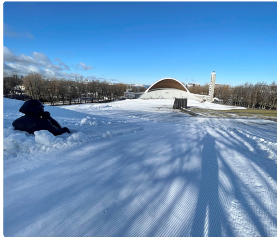
Tallinna lauluväljakule rajatakse esimeste öökülmade järel 0,7 km pikkune kunstlume suusaring, mis jääb linlastele avatuks.

1. jaanuarist käivitus liikumiskeskuses FitSphere kogu 2025. aasta