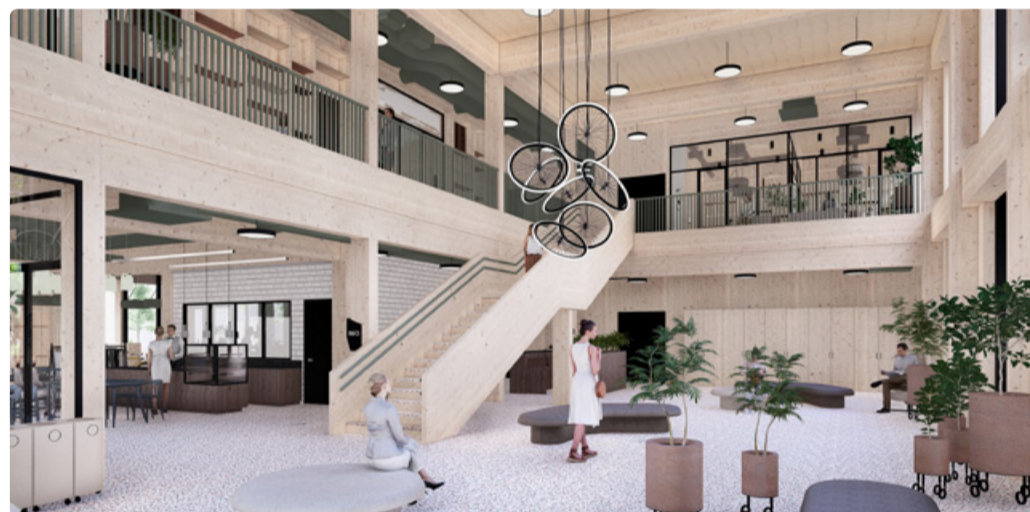
Lasnamäe ringmajanduskeskuse välisvaate ja fuajee eskiisid. Autorid: Kolm Koma arhitektid

Lasnamäe ringmajanduskeskuse arhi- tekt on Urmo Mets arhitektuurbüroost Kolm Koma ja selle projekteeris RTG Projektibü- roo AS. Ehitusprojekti aluseks oli Tallinna linnaplaneerimise ameti ruumiloome osa- konna visioon, mille sisuks on ringmajan-