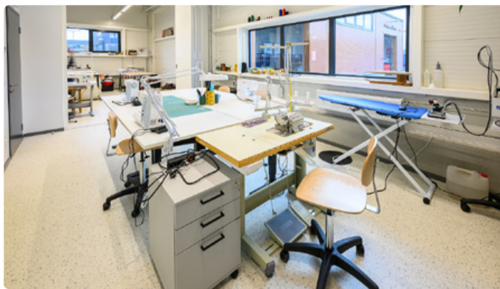
Lilleküla ringmajanduskeskus.

KIKi toetatud projektiga rajab linn punktid, kus inimesed saavad parandada tekstiilist, puidust ja metallist esemeid. Jäätmejaamades on nüüd korduskasutusruumid, kuhu inimesed saavad jätta kasu-