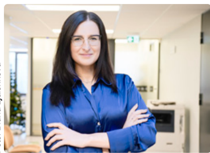
Linnaosa vanema veerg