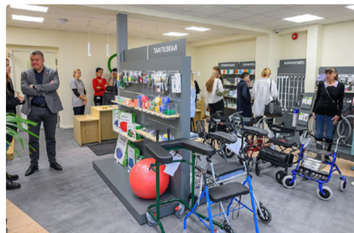
Esinduses on võimalik tutvuda liikumisabivahenditega.

Vastsündinutele ja värskele emadele leidub samuti mitmeid vahendeid, alates beebikaalust kuni rinnapumbani, ning neid saab soovi