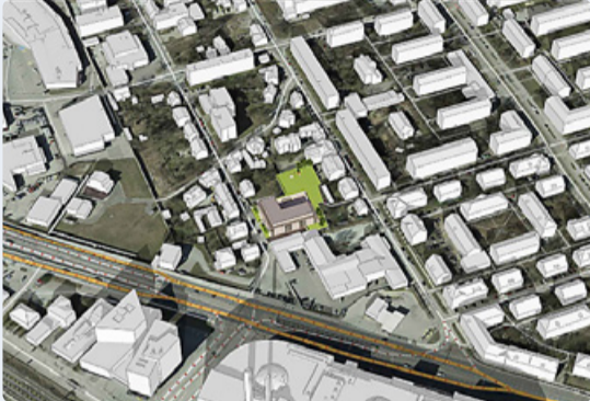
Katusepapi tn 29a ja 31 kinnistute detailplaneering. 3D-illustratsioon: Guru Projekt OÜ

Tallinna Linnavalitsus otsustas 17. detsembri 2024 istungil: