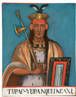
Портрет правителя инков Тупака Инки Юпанки авторства неизвестного художника. Ок. 1790–1810.

Фестивальные мероприятия, проходящие во внутреннем дворе и фойе музея бесплатны; посещение выставки и участие в экскурсиях и мастерских подразумевает покупку билета.