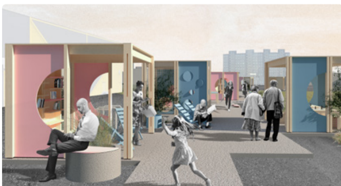
Визуализация: studio kollektiiv OÜ

В рыночном павильоне состоится ярмарка, где местные жители смогут торговать рукоделием или выпечкой собственного изготовления (подать заявку можно по адресу электронной почты stuudiokollektiiv@gmail.com ).