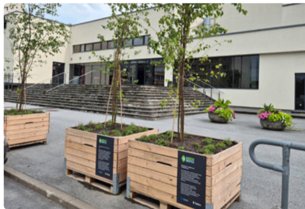
Центр культуры "Линдакиви".