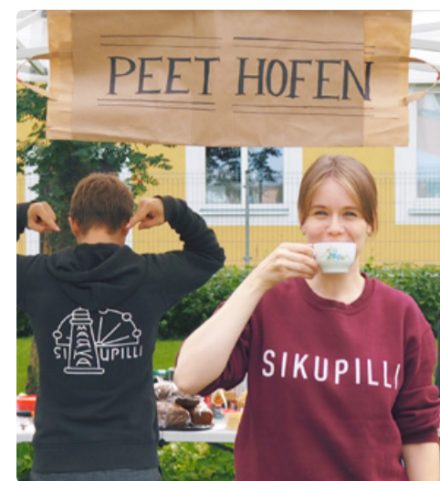
Уютная атмосфера дворовых кафе гарантирует хорошее настроение!

Местные жители могут отдохнуть от готовки и насладиться вкусной едой всего в нескольких минутах ходьбы от дома. Те, кто приехал издалека, могут поближе познакомиться с микрорайоном Сикупилли, где можно увидеть дома разных эпох в их подлинности и насладиться великолепным видом на Старый город со склона Ласнамяэ.