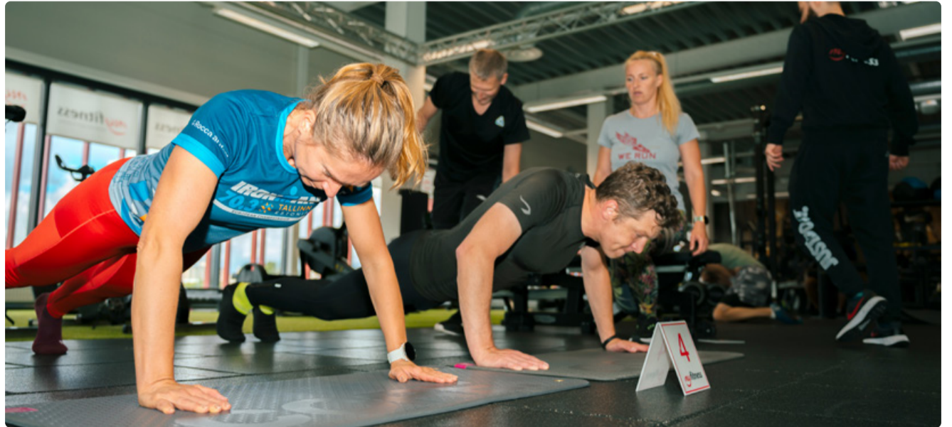
Мужчины и женщины на тренировке для продвинутых.

Парк Тондираба и спортклуб MyFitness Linnamäe приняли участников летнего спортивного дня Восточного отряда Таллиннской дружины Кайтселийта.