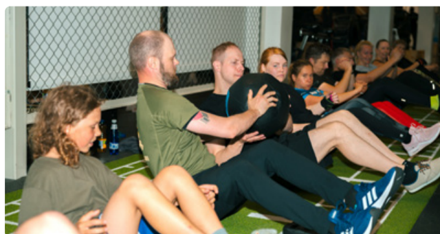
Слаженная командная работа – один из столпов Кайтселийта.

Членство в Кайтселийте – это особый стиль жизни, и если вы активны и готовы посвятить время своей готовности, а также готовности своих близких и своего района, то смело советую вступить в ряды Кайтселийта. Будучи участником Кайтселийта, вы можете вносить свой вклад в нашу деятельность в том объеме, который вам подходит и который вы считаете нужным. Это может быть как «хождение в мундире», так и финансовая поддержка. Некоторые из нас активно участвуют в совместных мероприятиях, другие играют скорее вспомогательную роль, принимая на себя, к примеру, решение вопросов логистики. Состав Восточного отряда постоянно увеличивается и наряду с пехотой и связным батальоном создаются подразделения, отвечающие за логистику, транспорт и организацию питания, в деятельность которых вы можете внести свой вклад в зависимости от ваших интересов. Здесь нет никакого принуждения, все добровольно и основано скорее на интересах участников – если человек заинтересован в определенной области, мы помогаем ему этот интерес реализовать, предоставляя место в соответствующем подразделении и необходимую подготовку. Я рад, что за последние два года к нам присоединилось много новых учеников, которые уже прошли армейскую службу, ведь таким образом новыми знаниями обогащается и Кайтселийт.