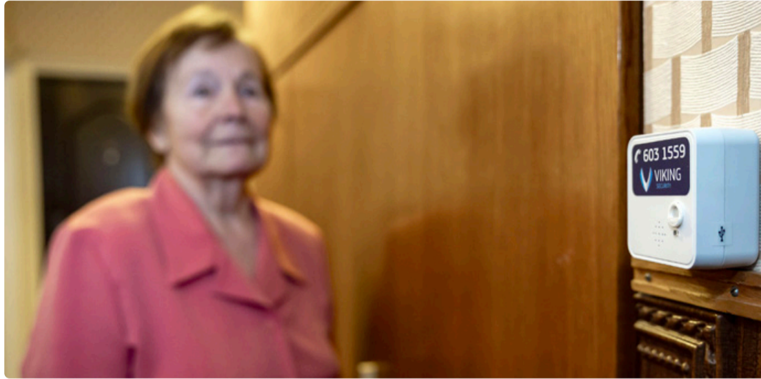
Маленькое устройство, которое может спасти жизнь.

Датчик анализирует ежедневные движения подопечного и реагирует в случае любых отклонений от привычной модели движения, которые могут указывать на падение или проблемы со здоровьем. Таким отклонением может стать, например, неподвижность человека в то время, когда он обычно передвигается, либо более продолжительный, чем обычно, период неподвижности. В таких случаях устройство автоматически посылает сигнал тревоги, и пострадавшему не придется звонить в спасательные службы. По предварительной договоренности сигнал может поступать в диспетчерский центр охранной компании Viking Security и/или на телефон (либо адрес электронной почты) родственника пострадавшего. Отклонения от привычной модели движения фиксируются охранной компанией круглосуточно с тем, чтобы на них можно было незамедлительно отреагировать. Если с человеком не удастся связаться по телефону, охранное предприятие сразу же выезжает на дом, оказывает при необходимости первую помощь или направляет на дальнейшее медицинское