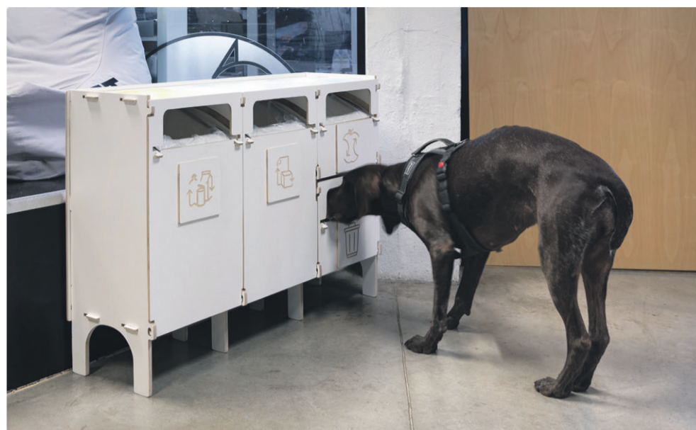
Jäätmete liigiti kogumine võtab hoogu nii kodumajapidamistes kui ka kontorites. Eesti Keskkonnateenused

Biojätmete kogumise statistika näitab, et nende liigiti kogumine on kasvutrendis kõikides piirkondades, kus EKT biojätmeid veab. See näitab, et inimesed oskavad ja tahavad jäätmeid liigiti koguda, kui selleks on loodud mugav võimalus kodu lähedal. Tallinna linnaosad on biojätmete kogumises alates 2023. aasta algusest läbi teinud suure kasvu. Kõige tublimad on olnud Pirita, Haabersti ja Kristiine elanikud, kuid ka Põhja-Tallinnas kogused kasvavad järjest. Lasnamäel on inimesi palju ja kogused suured – kui biojätmete kast on ühistu poolt organiseeritud, siis hakkavad inimesed heal meelel eraldi biojätmeid koguma. Iga kuuga kogused tasapisi kasvavad – järjest rohkem lisandub teadlikke liigiti kogujaid.