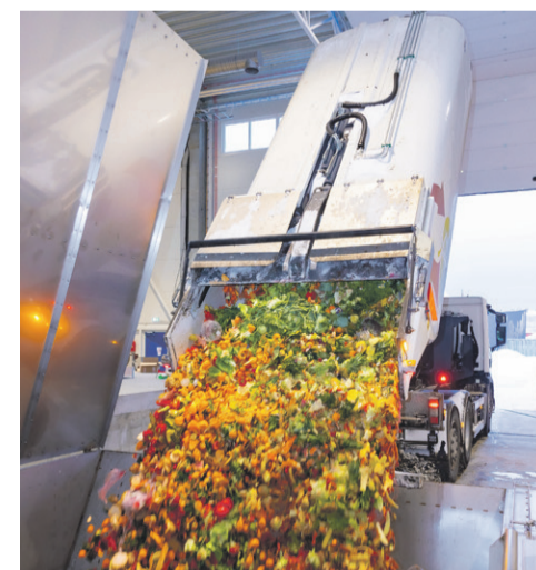
Biogaasi tehasest saab biojätmetest gaas, mida on võimalik kasutada ka elektri tootmiseks. Eesti Keskkonnateenused

Sellest, mis peaks jõudma segaolmekonteineritesse, kui bio- ja pakendijätmed õigesti sorteerida, ning teistest jäätmete liigiti kogumist hõlbustavatest võtetest saab lugeda juba järgmises Lasnamäe Lehe numbris.