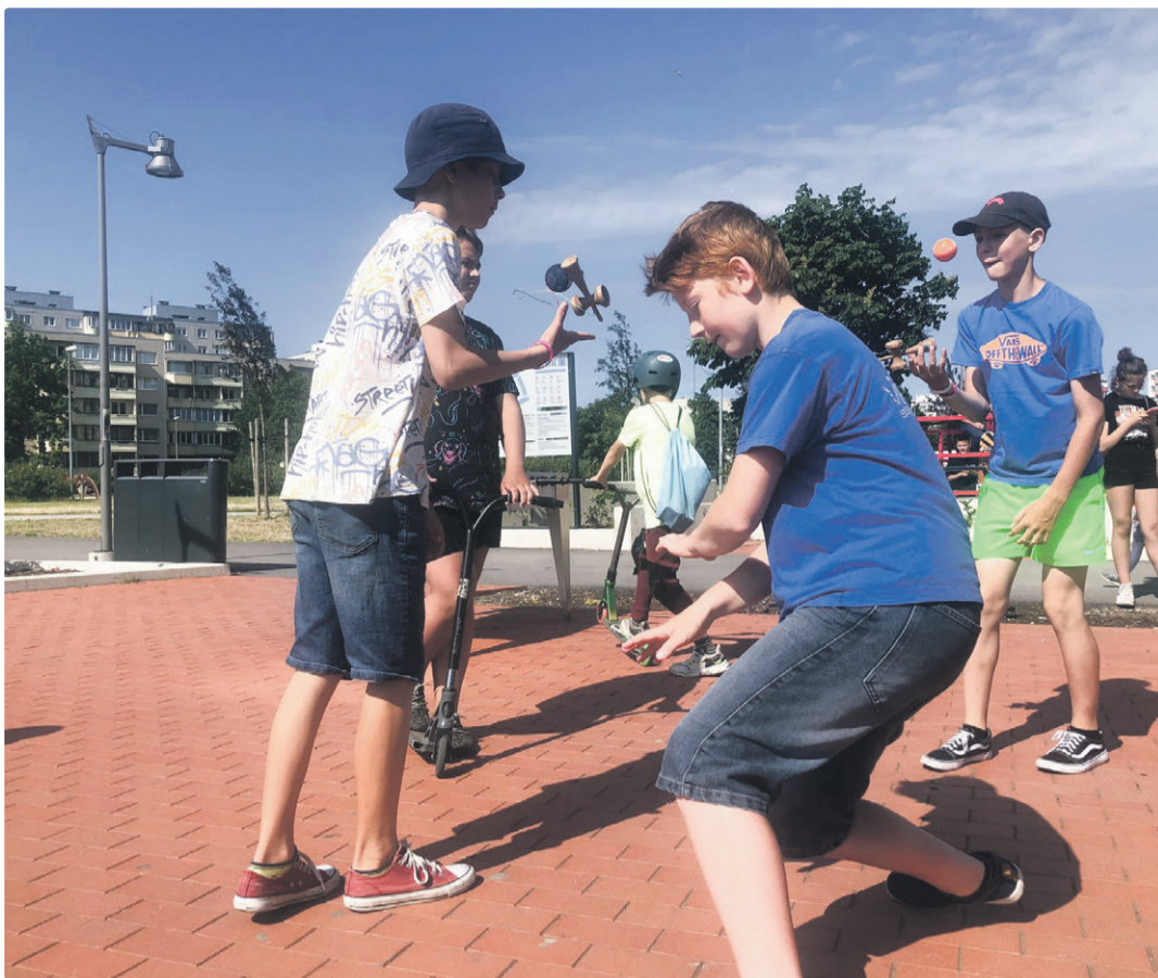
Летняя программа закончится 22 августа минифестивалем в парке Кивиля.