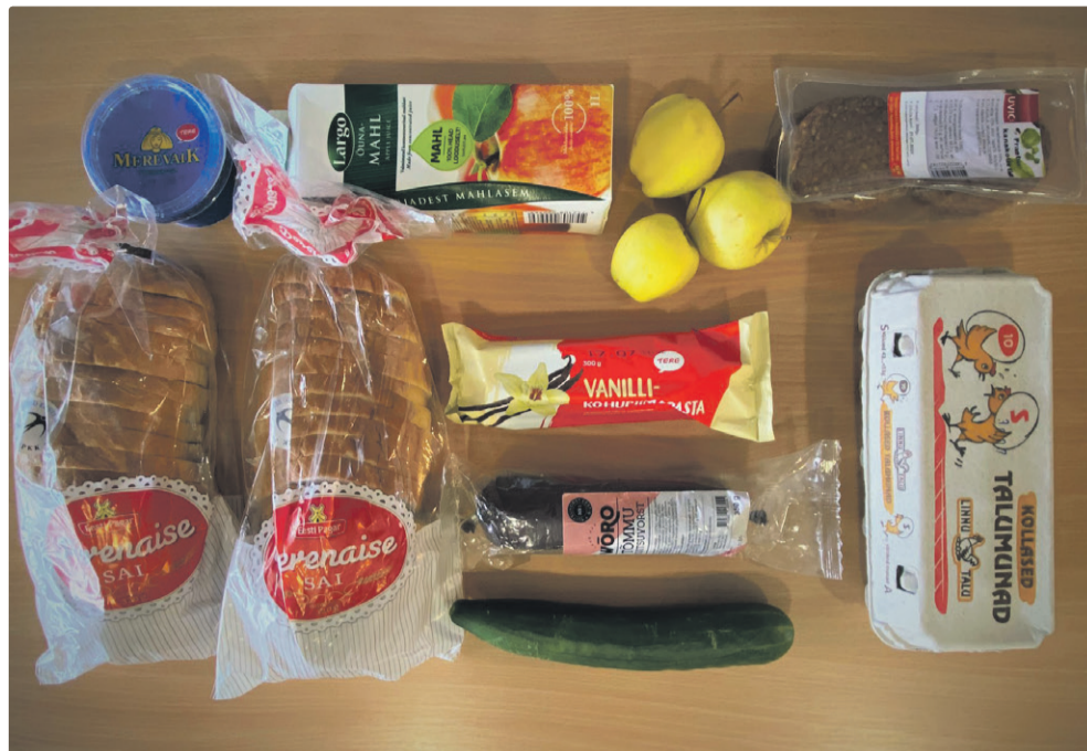
Продуктовая помощь выдается из расчета один комплект на одного ребенка в неделю. Фото носит иллюстративный характер.

Заявление о получении помощи можно представить в отдел социального обеспечения управы по адресу ул. Палласти, 54 или ул. Махтра, 48 (по понедельникам с 9 до 12 и с 14 до 17.30, а также по четвергам с 9 до 12