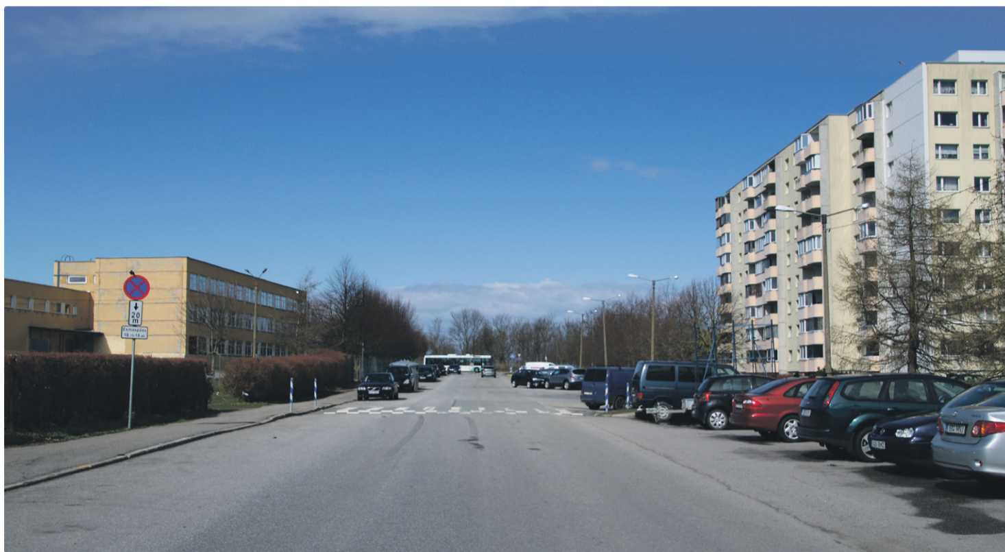
Kvartaliseste teede taastusremont kestab terve suve.