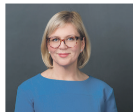
Eha Võrk Tallinna abilinnapea

Korteriühistute tegevus määrab suuresti linna näo – selle, kui atraktiivse, ohutu või kodusena nii elanikud kui ka külalised linna tajuvad.