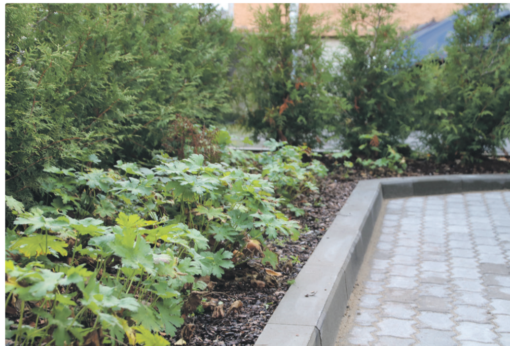
„Rohelise õue“ toetuse abil saab haljastada korterelamu ümbrust.

Tallinn toetab ka korterelamu energiatõhususe ja ohutusega seotud tegevusi. Neist