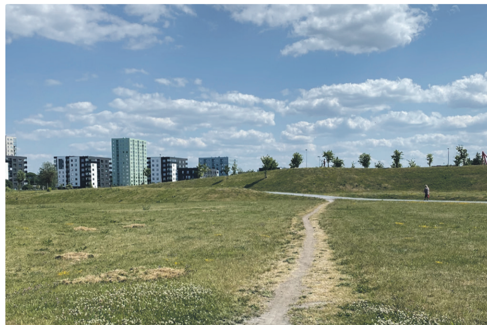
Ka Pae pargis leidub alasid, mis vajaksid lisateede rajamist.

Tallatud rajad võivad kohati viidata mingile planeerimise puudusele, aga samas ei pruugi see nii olla. Tallatud radade teke on loomulik linnakeskkonna ümberkujundamise protsess, mis võib viidata inimeste soovile viibida looduslikumas keskkonnas või omada erinevaid valikuid. Sellisel viisil kujundavad inimesed keskkonda endale meelega, mis peaks iseenesest olema ju heaks eelduseks ka