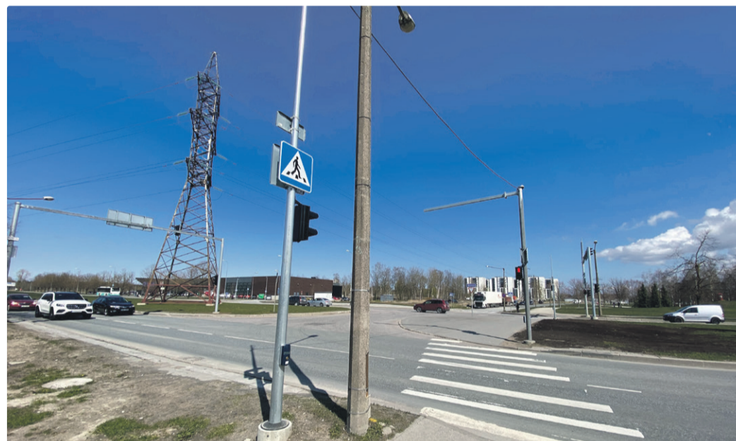
По улице Ю.Смуули можно быстро добраться как до Лаагна теэ, так и до Певческого поля.