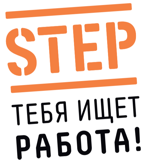
Уже 4 года программа STEP сводит работников и работодателей, чтобы помочь им найти друг друга.

Программа привлечения молодежи на рынок труда STEP иницирована Министерством внутренних дел и финансируется Европейским социальным фондом в период 2014–2020 гг. Программу проводит OK Arenduskeskus на территории Харьюмаа (в том числе и в Таллинне).