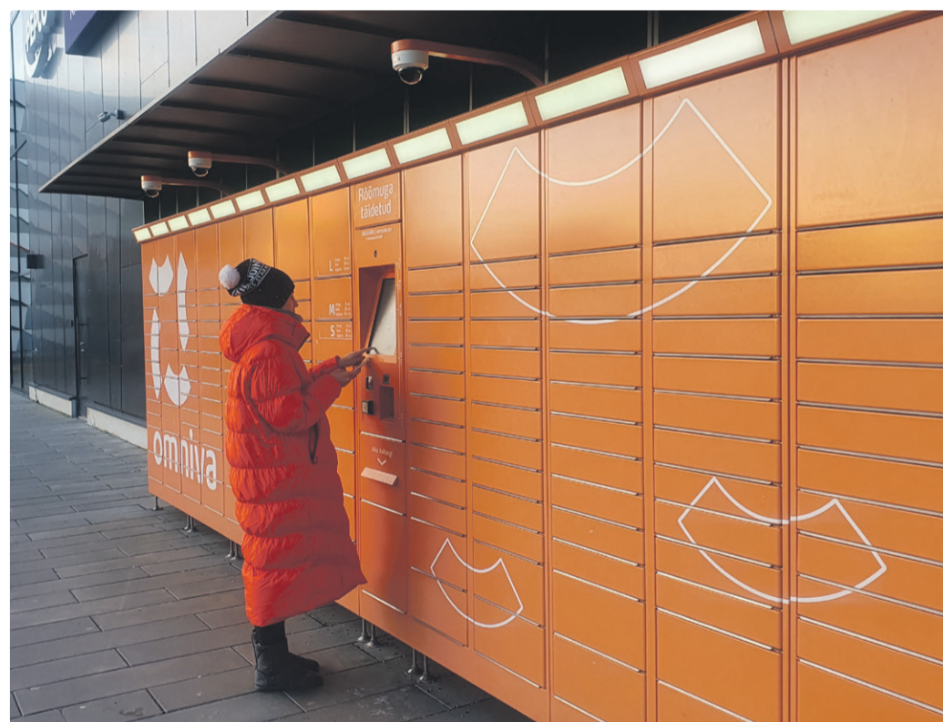
Автомат можно использовать, не соприкасаясь с открытыми поверхностями.

Во время чрезвычайного положения оборот посылок в Эстонии увеличился на 34% по сравнению с прошлым годом, а вот количество посылок, отправленных через посылочные автоматы, увеличилось более чем вдвое, что сопоставимо с тем, что мы наблюдаем накануне зимних праздников.