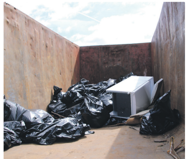
Опасные отходы можно сдать в 14 временных пунктах приема.