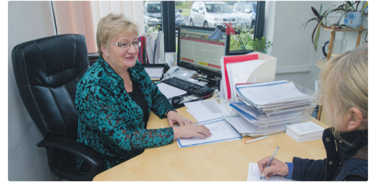
Прием жителей возобновляется при условии соблюдения принципа 2+2.

Контактные данные: Услуги на дому: piret.talve@lsk.ee, nadezda.koneva@lsk.ee, тел. 621 4350. Дневной центр для пожилых: ylle.mets@lsk.ee, 621 8998, тел. 5301 0410. Детский дневной центр: katrin.kuuseorg@lsk.ee, тел. 621 2206.