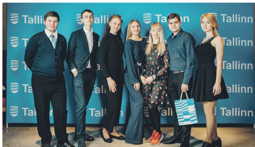
Во многом благодаря формату NoorPROFF молодежный совет Ласнамяэ был отмечен городскими властями как одно из лучших молодежных объединений города на торжественном гала по случаю завершения конкурса «Великие дела».

В ближайшее время в целях безопасности мероприятия серии NoorPROFF будут продолжаться в онлайн режиме. Своими идеями относительно возможных гостей для новых мероприятий можно поделиться по адресам электронной почты lasna.noortenukogu@gmail.com или lasnamae@noortekeskus.ee.