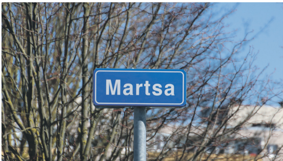
Строительные работы пройдут летом в том числе на улице Мартса.

В ходе ремонтных работ на внутриквартальных дорогах снимается старый слой асфальта и укладывается новый, восстанавливается озеленение и устанавливаются новые указатели дорожного движения. В районе также ведется интенсивный восстановительный ремонт магистральных дорог.