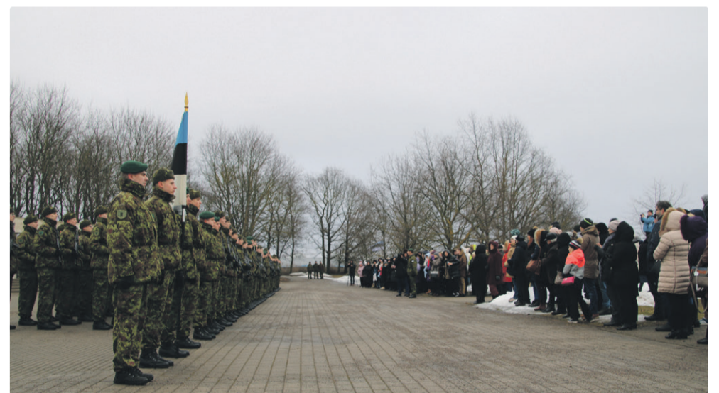
Парк Юрьевой ночи стал традиционным местом принесения воинской присяги.