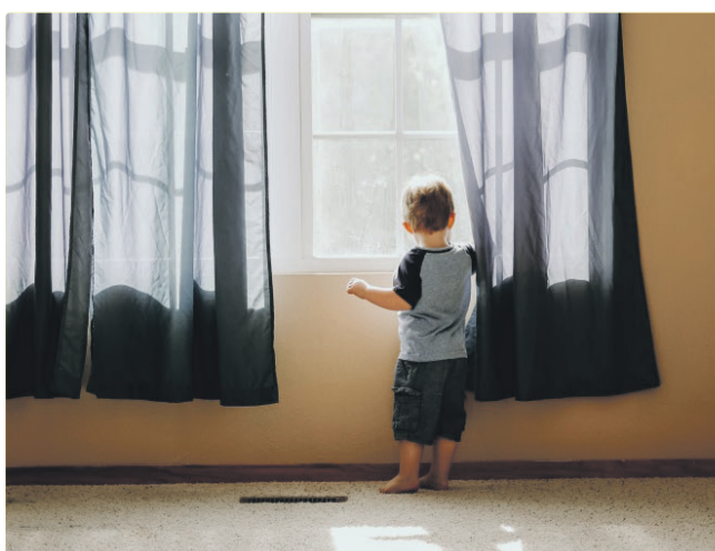
Временно закрыты общественные и муниципальные спортивные и детские площадки.

Государственный надзор за закрытием площадок и соблюдением запрета на их использование и пребывание на них осуществляют управы районов города, Департамент окружающей среды и коммунального хозяйства и муниципальная полиция. В случае невыполнения распоряжения осуществляющее надзор лицо имеет право применить меры принуждения, упомянутые в чч. 1-3 статьи 28 Закона об охране общественного порядка.