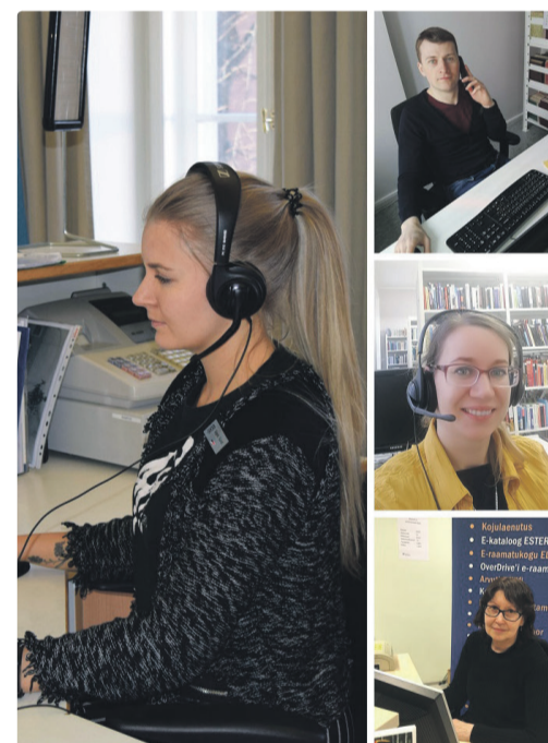
С сотрудниками библиотеки можно общаться по Skype, необходимым навыкам научат в рамках специальной программы обучения.

Оставайтесь в курсе событий. Присоединяйтесь к группе Facebook: Tallinna Keskraamatukogu seniiorid.