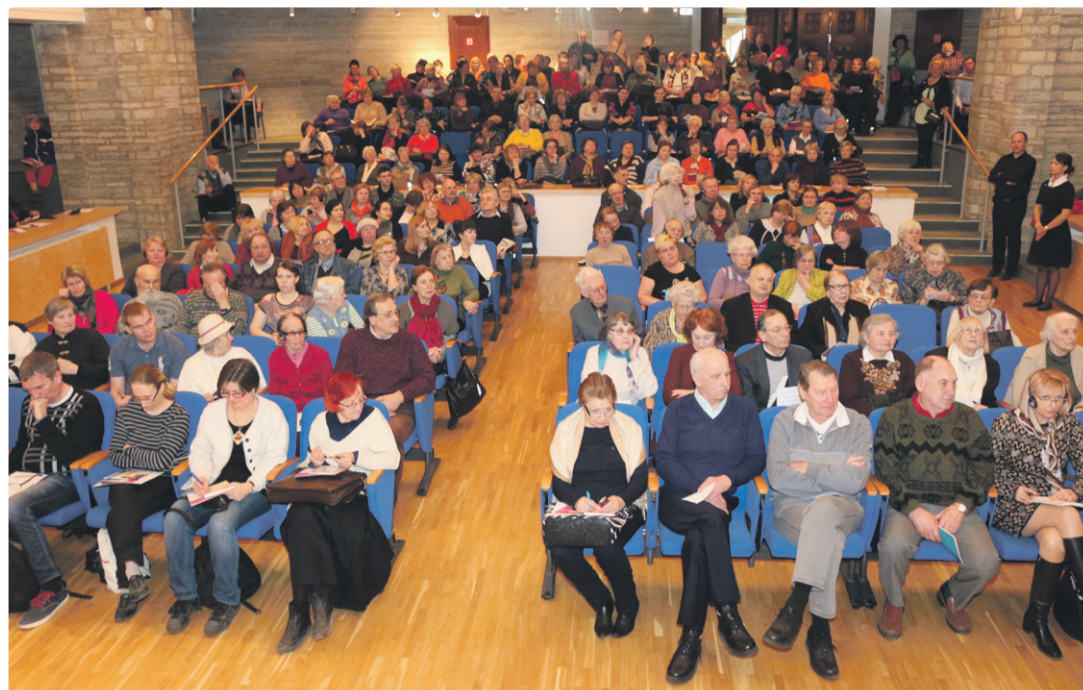
Среди тем мероприятия – э-торговля, особенности сдачи внаем жилых помещений, изменения I пенсионной системы.