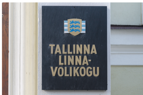
О записи на прием можно узнать у советников фракции.