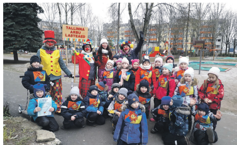
Спортивный праздник начался с общей зарядки.

Олимпиада завершилась церемонией награждения, на которой все детские сады получили памятный диплом, после чего маленькие спортсмены подкрепились чаем и сухариками.