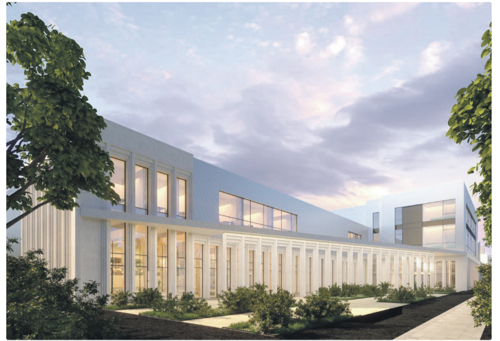
Один из вариантов внешнего облика бассейна в Тондираба, который планируется сдать в эксплуатацию не позднее 2025 года.

Городок интеллектуального предпринимательства Ülemiste City широко известен как место сосредоточения офисов высокотехнологичных предприятий, но мало кто знает, что чуть дальше по ул. Суур-Сыямяэ действуют несколько производственных и складских центров крупнейших театров столицы – Эстонского драматического и национальной оперы «Эстония». Летом этого года здесь же откроют складской комплекс Городского театра.