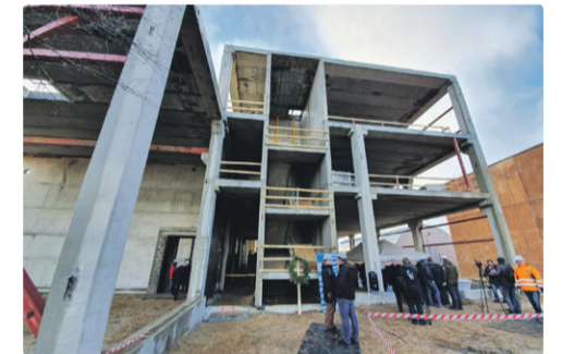
На празднике стропил производственно-складского комплекса Городского театра на ул. Суур-Сыямяэ.

аналогии с Нью-Йорком (ни много ни мало!) городом возможностей. Может быть, пора отказаться воспринимать Ласнамяэ как бетонные джунгли и думать о нем именно так – как о районе возможностей?