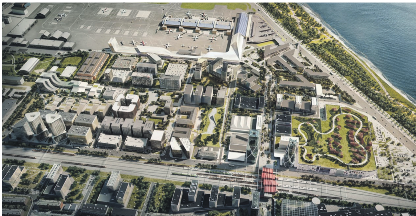
Визуальное решение будущего делового городка Ülemiste City.

Почему наш район уже нельзя назвать спальным