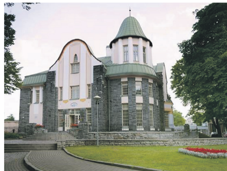
Дворцу бракосочетаний исполняется в этом году 110 лет.

Юбилейный год прошедшей недавно основательную реконструкцию виллы начнется со дня открытых дверей, который состоится в пятницу 21 февраля с 14 до 19 часов. В 14 часов публике будет представлена программа культурных мероприятий, а затем собравшихся ждет фортепианный концерт в зале регистрации браков на третьем этаже. В 15 часов можно будет принять участие в экскурсии на эстонском языке. На протяжении всего дня открытых дверей у гостей мероприятия будет уникальная