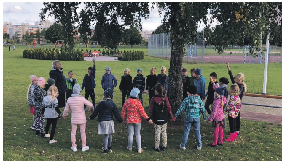
Рано усвоенные простые истины запоминаются на всю жизнь.

Одной из главных целей программы является ходатайствование о получении уже упомянутого экологического сертификата «Зеленый флаг». Действует он два года, для его полу-